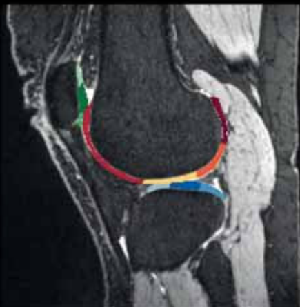
Segmentácia kolennej chrupavky pomocou AI

Automatizovaná, kvantitatívna a štruktúrovaná analýza kolennej chrupavky pre systém syngo.via