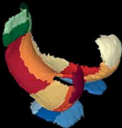
3D model chrupavky